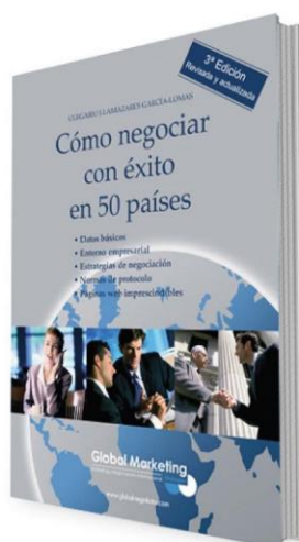
Cómo negociar con éxito en 50 países PRECIO 25€