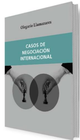
Casos de Negociación Internacional PRECIO 14€