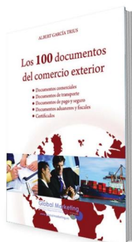
Los 100 documentos del comercio exterior PRECIO 25€

Compra Online: www.globalnegotiator.com Información: 91 578 26 67 info@globalnegotiator.com