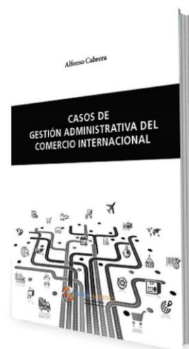
Casos de Gestión Administrativa del Comercio Internacional PRECIO 14€