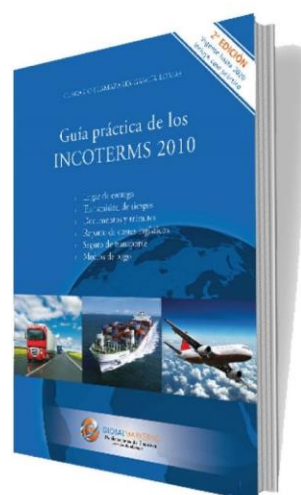
Guía práctica de los Incoterms 2010 PRECIO 22€