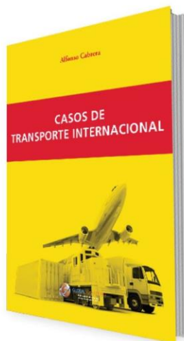
Casos de Transporte Internacional PRECIO 14€