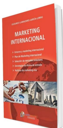
Marketing Internacional PRECIO 19€